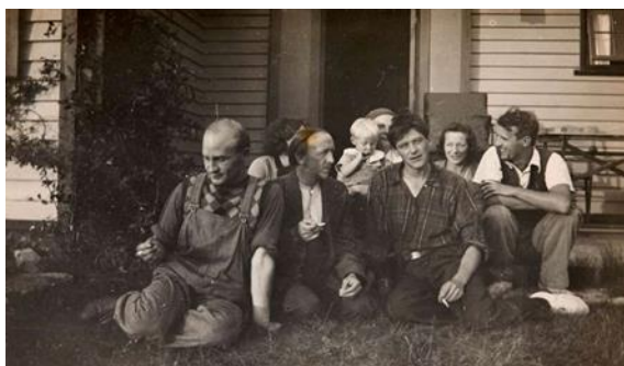
Odsherredsmalerne, 1930'erne.

Forløbet indledes med en dialogbaseret introduktion til kunstbegrebet, Odsherred som område og Odsherredsmalerne. Vi kigger på spørgsmål som: Hvad er kunst og hvad kan man opdage i kunstnerens univers? Hvordan bliver idéer, følelser, oplevelser og inspiration fra det virkelige verden omsat til et kunstværk? Hvem var Odsherredsmalerne og hvad var det særlige ved deres univers? Ud over udvalgte værker i samlingen inddrages kulturhistorisk billedmateriale, sjove fortællinger og sansebaserede iagttagelsesaktiviteter for at levendegøre det kunst- og kulturhistorisk materiale.