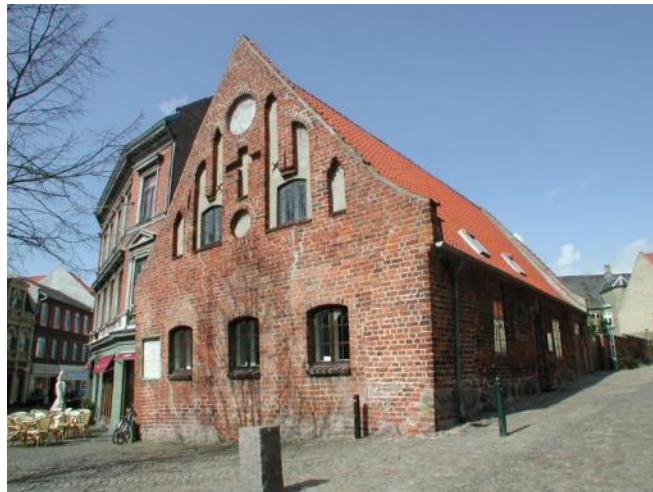
Slagelse Latinskole set fra sydøst År: 2006

Den gamle latinskole i Slagelse: Et af nedslagspunkterne i Slagelse byrum på elevernes byvandring var den gamle latinskole i Slagelse. Her skulle eleverne gå på jagt efter Ingemanns "graffiti". De fik også et indblik i latinskolens historie, herunder skolens forskellige placeringer i byen gennem tiden samt H.C. Andersens skoleforløb og oplevelser i Slagelse. Eleverne blev opfordret til at reflektere over den historie, der har fundet sted lige omkring dem i deres kendte byrum, som har helt andre moderne associationer for dem i hverdagen.