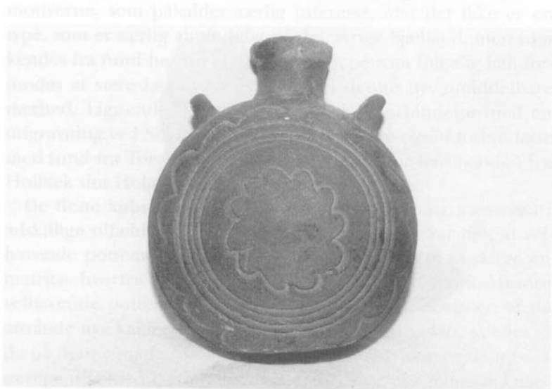
Den sjældne pilgrimsflaske, der fik sin egen niche i det nye stuehus.

Fundet, som er indleveret til Holbæk museum dels som gave dels som lån fra ejeren af Vindmosegaard, viser at her havde der, om man i 1924 havde været omhyggelig, været mulighed for at finde det meste af en af samtidens bedste ovntyper. Den nedbrudte ovn har antagelig ligget i en kælder fra et tidligere stuehus. Leger man med tanken om, hvad der mon nu kan være sket, så er det snublende nær at henlægge en idag glemt begivenhed - et nedbrændt stuehus - til svenskekrigene 1658-60.