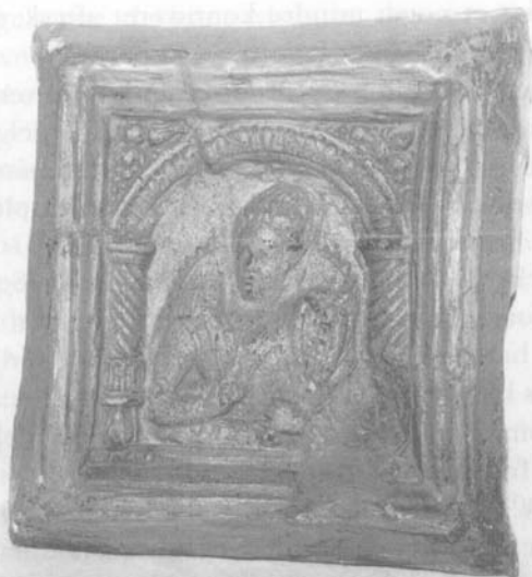
Den firkantede kakkel med kvindefiguren. Den opstående kniplingskrave og de karakteristiske hjørnemotiver ses tydeligt.