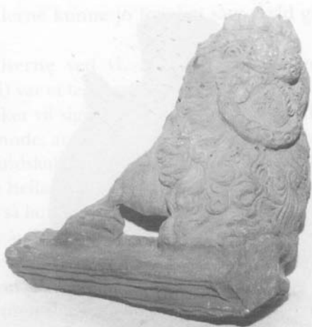
Den ene halvdel af det løveornament, som har dannet hjørne på kakkelovnen.