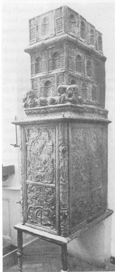
Kakkelovn fra 1630'erne. Indfyringskammeret er af støbejern mens overdelen er af kakler. Det er disse kakler man senere gik over til at bruge uglaserede og sværte med "isenfarve". Kaklerne på den afbildede ovn er dog grønglaserede.

Det er naturligt at de mest ornamenterede kakler, som var sværest at lave, og som var mest dekorative, var de kosteligste. Ovne, som havde mangefarvede dekorationer, var derfor sjældne. Billigere var de mere enkle rudekakler, som på deres rektangulære flader kun havde et rudeornament med en udsmykning i hjørnerne, oftest et delfin motivsammenslynget med et planteornament. Billigst var selvfølgelig de ovnkakler, som var uden noget dekorationselement overhovedet.