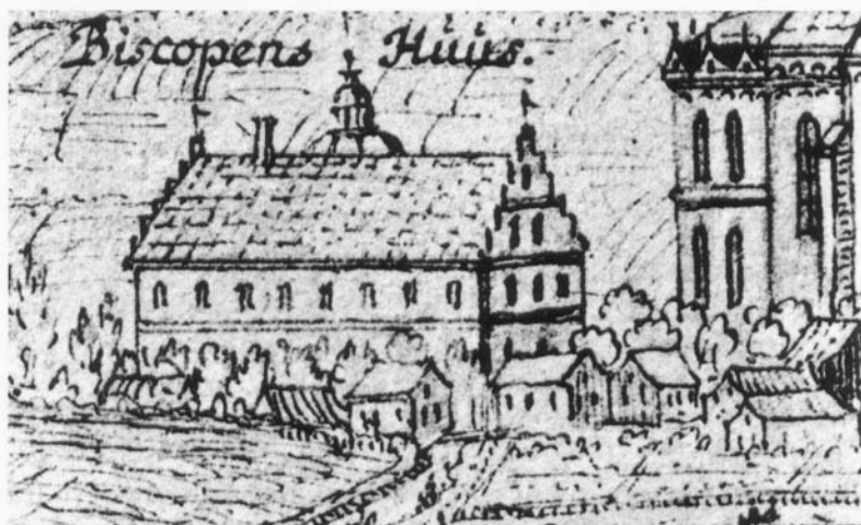
Billedet af biskoppens hus i Lund giver et indtryk af udseendet af den del af Thorups stuehus, der havde trappetårn. Gavlene og de vandrette bånd må have været næsten identiske.