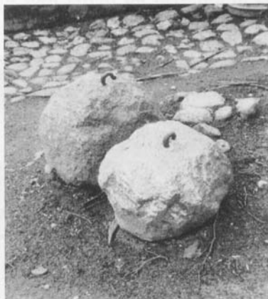
Lodderne til urværket.

Endnu en sten, som havde haft en anden funktion, nemlig gårdens »ridesten« – som man benyttede sig af ved påstigning eller afstigning af hesten ved hoveddøren, ligger et underligt