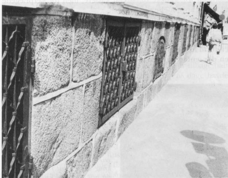
Sokkelen på Niels Juels palæ med de store og fine sten.

Ved dræningsarbejde i området, hvor Torup tidligere lå, fandtes en herlig kvadersten af nogenlunde samme format, og da størrelsen efter sjællandske forhold er så relativt usædvanlig, må det være rimeligt at formode, at stenene oprindeligt har været anvendt enten i kirke- eller klosterbygninger i Holbæk, eller også fra klosterbygningen på Munkholm. På voldstedet fandtes nemlig også rester af kridtstensbånd, som meget vel kan stamme fra sidstnævnte sted.