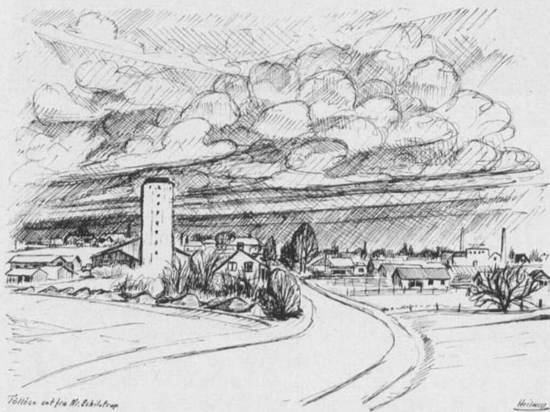
Tølløse set fra N. Skibstrup

de ønsker det, må involveres i et nært samarbejde, for derved kan alle parter på længere sigt også være med til at påvirke fremtiden i en positiv retning og forhåbentlig blive til glæde og gavn for alle, der har valgt at virke og bo i Tølløse.