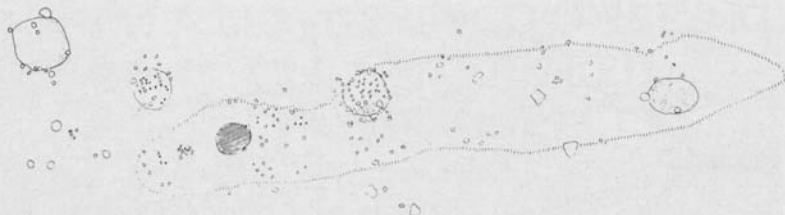
Fig. 5. Opmåling af stenlægningen i udgravningen. Priksignatur angiver kraftig muldblanding. Stregssignaturen viser resterne af et bål. En del af feltet udfyldes af en revle af mindre sten med muldblanding – afgrænset på fig. med lodrette streger. (Efter Ramskou 1970).

I 1970 fortsattes undersøgelserne syd for den lille høj på toppen af bakken i centrum af cirklerne. Denne gang i den mellemste cirkel, der afslørede nye forhold. Her fandtes overhovedet ikke hvad der kunne tolkes som fundamenter for oprejste sten. Derimod fandtes der et par store gruber, nedgravede i undergrunden, fyldte med sten og bålrester, samt en del lerkarskår. Alle desværre små og overbrudte, så de ikke umiddelbart kunne give en datering af anlægget. Men grubernes placering stemmer stadig med de punkter, der kan ses på luftbilledet, så sammenhængen mellem yderste og næste kreds er evident.