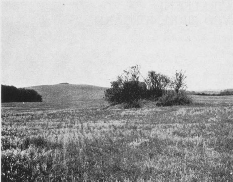
Fig. 1. I baggrunden af billedet Overdrevsbakken, på toppen skimtes den lille gravhøj, der danner centrum i det cirkulære anlæg. Set fra sydvest. (Efter Ramskou 1970).

naturlige jordlag. Som eksempel kan fremføres noget så enkelt som bygning af et hus, lad os sige et jernalderhus. I dét var taget båret af et antal stolper, der har været gravet ned i jorden. Væggene kan have været af græstørv og gulvet af ler, der kan være hidrørt fra et andet sted. Idag er væggene måske udpløjede, ligesom gulvet kan været spredt over et større areal; der er intet mere at se. Men stolpehullerne er der endnu, de går under pløjedybde, og kan derfor under visse omstændigheder gøre opmærksom på deres tilstedeværelse, hvis man har øjnene med sig. Ligger der f.eks. et system af stolpehuller på en mark, hvor jorden ellers ikke er alt for god, siger det sig selv, at den afgrøde, der vokser over stolpehullerne har bedre vækstbetingelser end den, der vokser udenom, ganske simpelt fordi muldlaget i stolpehullet er blevet tykkere, stedet er mere frugtbart. Flyver man hen over marken en tidlig forårsdag, når afgrøden ikke er blevet alt for høj, og på et tidspunkt, da solen står lavt, vil man se