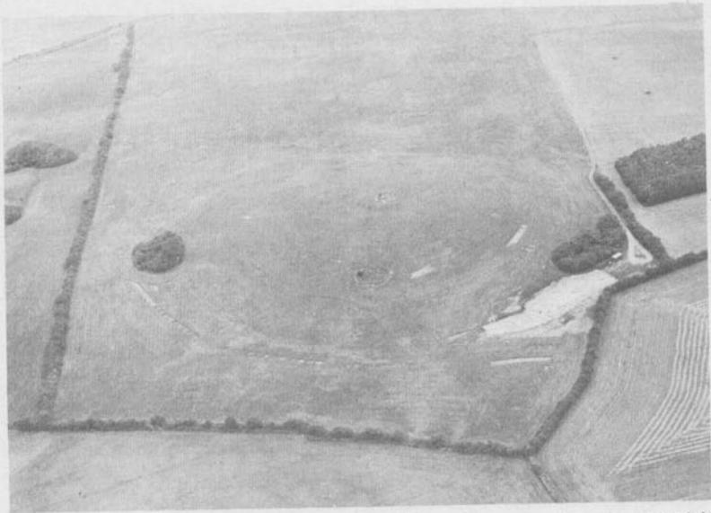
Fig. 6. Luftfoto af Overdrevsbakken under udgravningen, set fra syd. (Thorkild Ramskou fot.).

Det er kun på de britiske øer man kan finde noget, der svarer til anlægget på Birkendegård, nemlig de såkaldte „henge-monuments“, der har hentet deres navn fra det berømte Stonehenge. Og der er ingen tvivl, det har drejet sig om et monument af samme karakter, uden at man derfor skal tro, at cirklerne på Sjælland kan have haft samme betydning som astronomisk observatorium, som man mener deres engelske kollega har haft. Der er på Birkendegård ikke tale om noget astronomisk anlæg af nogen som helst art. Og tro endelig ikke, at der her har stået meterhøje sten med overliggere. Det har vi aldrig haft materialer til her i landet.