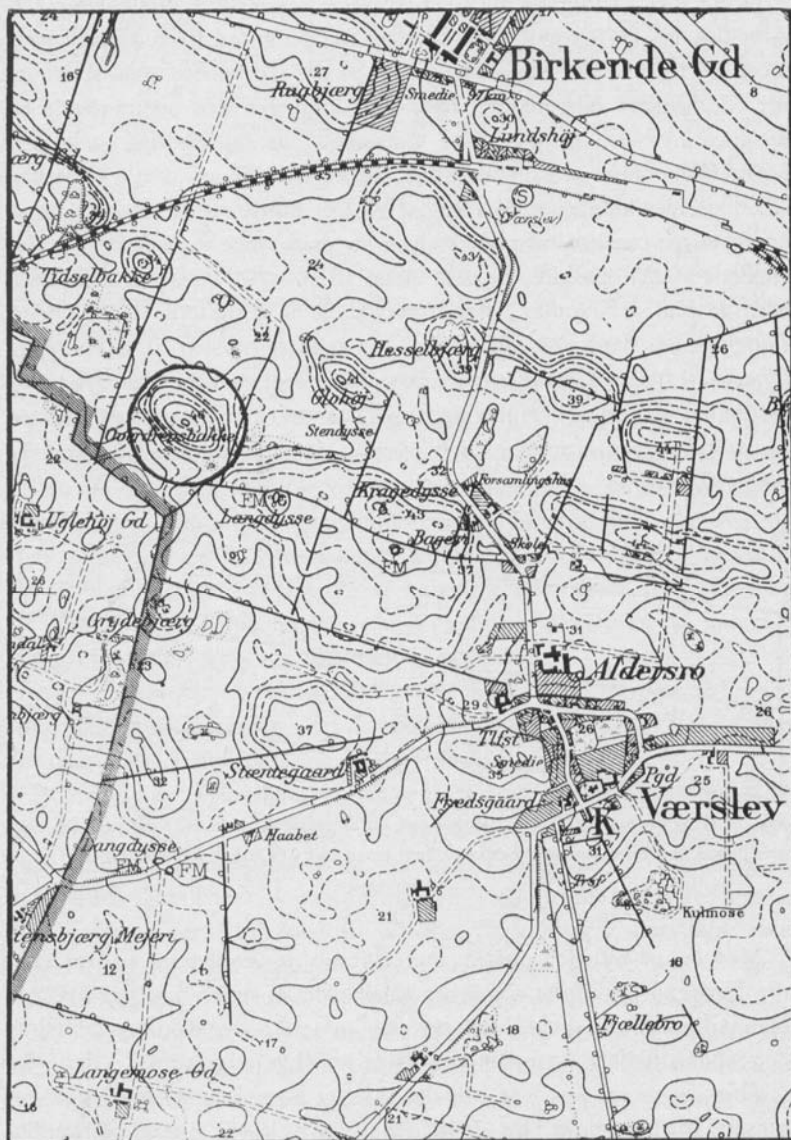
Fig. 3. Målebordsblad (M 3221) over området omkring Overdrevsbakken med stencirklen indtegnnet. (Reproduceret med tilladelse (A 1159/71) af Geodætisk Institut).