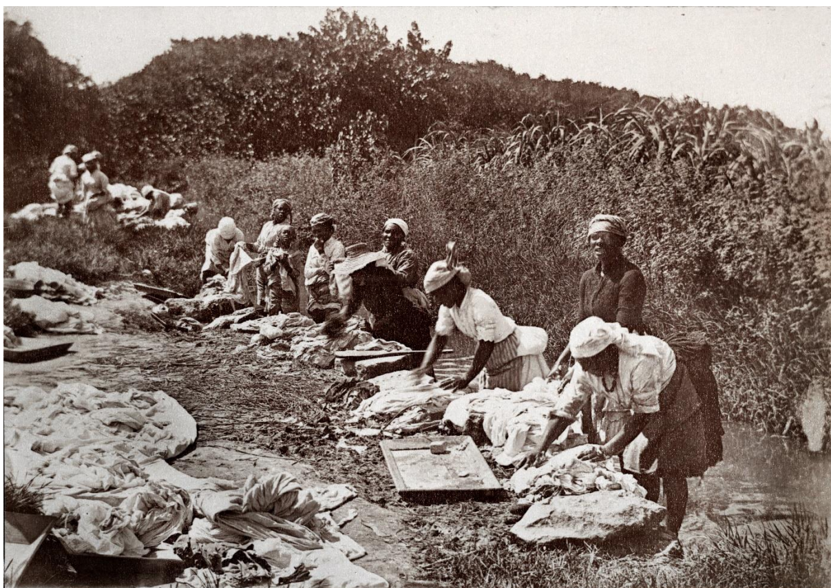
Tøjvask ved en bæk ca. 1890, Nationalmuseet

Kort beskrivelse: Vestsjælland/Vestindien er et dialogbaseret undervisningsforløb på Holbæk Museum. Eleverne undersøger i fællesskab den caribisk-danske kolonihistorie gennem levende dialog og diskussionsorienterede elevaktiviteter. De beskæftiger sig med det koloniale samfunds magtstrukturer, med slaveriet og kampen for frihed. Forløbet afsluttes med en diskussion af de sociale og politiske konsekvenser som 250 års kolonialisme har haft.