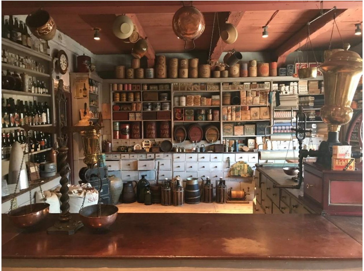
1800-tals krambod i købmandsgården på Holbæk Museum.